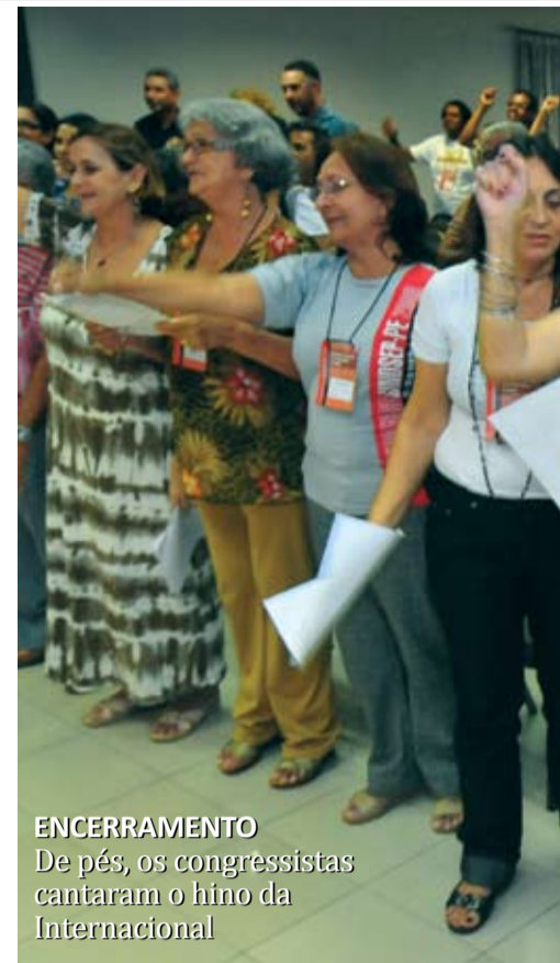
ENCERRAMENTO De pés, os congressistas cantaram o hino da Internacional

Nos dois primeiros dias de congresso, os delegados assistiram a três palestras. A primeira sobre a crise mundial, a outra sobre qualidade do serviço público e, por fim, uma que tratou das eleições 2010. Os debates subsidiaram os congressistas para, no dia 25 de novembro, participar dos grupos de trabalho. Foi aí que os delegados puderam discutir as conjunturas internacional, nacional e estadual, além de analisar a situação do movimento sindical e debater propostas para o plano de luta ( ver na página ao lado ), aprovado no último dia do evento e que irá nortear as ações do Sindsep nos próximos anos.