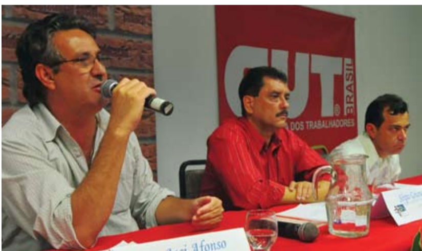
MUNDIAL Palestra abordou os desafios na superação da crise