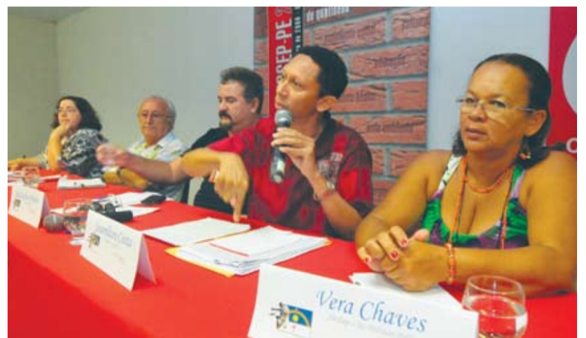
PREOCUPAÇÃO Governo e servidores buscam melhor atendimento