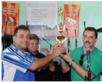
TORNEIO Em Garanhuns (acima) e em Recife (ao lado) o dia foi de futebol