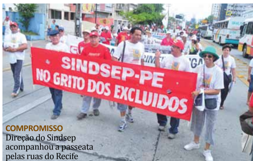
COMPROMISSO Direção do Sindsep acompanhou a passeata pelas ruas do Recife

Paralelamente ao 15º Grito dos Excluídos, em Garanhuns os movimentos sociais também promoveram o Grito dos Excluídos no município. Nesse caso, foi a sexta edição. O Sindsep