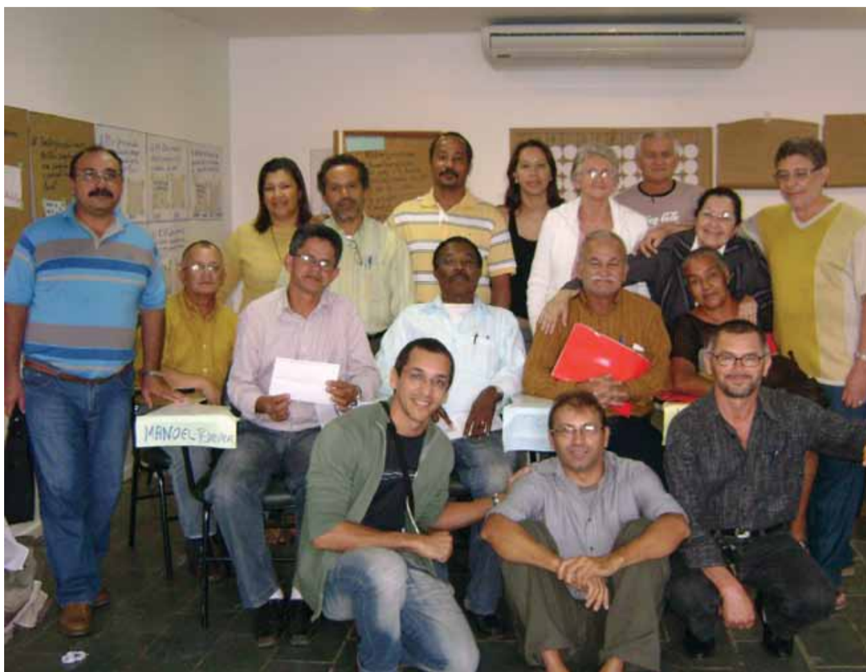
GARANHUNS Seminário reuniu representantes sindicais, diretores, Núcleo dos Aposentados e filiados

Os seminários realizados resultaram em desdobramentos importantes. Os servidores chegaram à conclusão de que os diretores territoriais de base, os representantes sindicais e os integrantes do Núcleo dos Aposentados devem trabalhar melhor a mobilização, reunindo-se mais para a busca de ações efetivas e adequadas à realidade de cada região. Devem ser ampliadas discussões sobre demandas específicas, bem como rediscutidas as organizações por local de traba-