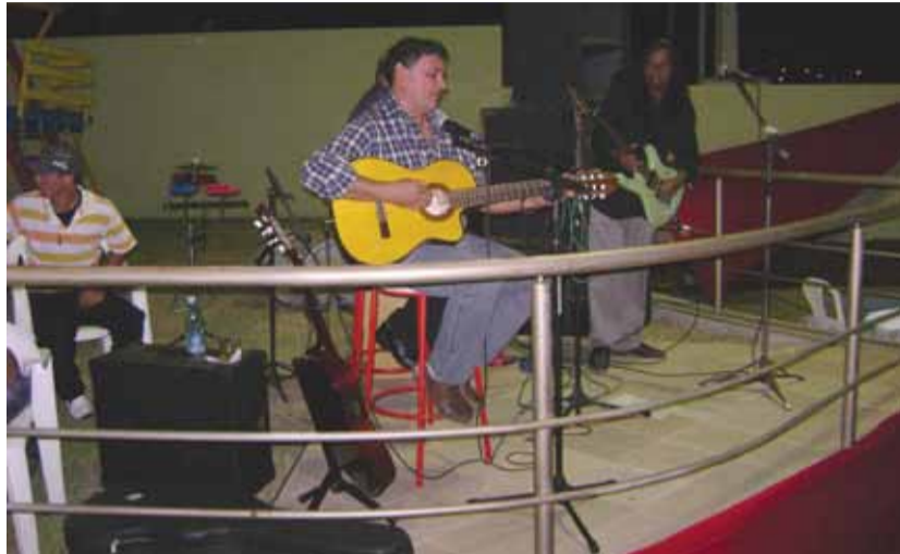
INCENTIVO Sindsep estimula o talento artístico dos servidores

Durante o dia, aconteceu a reunião da direção administrativa do sindicato, da qual fazem parte os diretores executivos, territoriais de base e o conselho fiscal. No encontro, a diretoria voltou as atenções para os preparativos do 10º congresso do Sindsep-PE, previsto para final