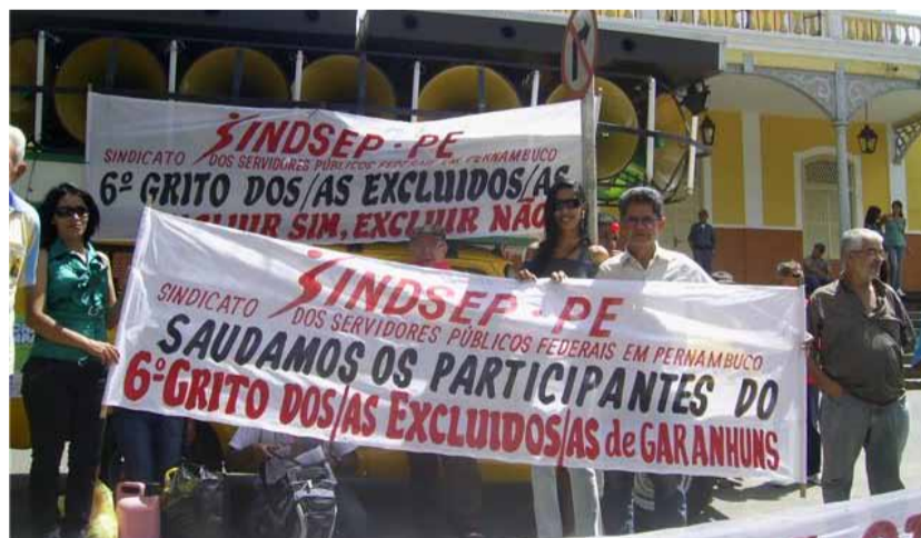
AGRESTE O Sindsep esteve presente no desfile de Garanhuns

PE esteve presente no ato. Um fato inusitado marcou o desfile em Garanhuns. Pouco antes da passeata entrar na avenida principal, o motorista do carro de som que acompanhava os manifestantes foi ameaçado através de um telefonema anônimo. O fato não intimidou a população. “O Grito dos Excluídos