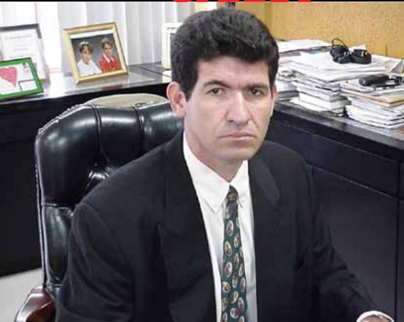
QUEIROZ "Servidores devem intensificar fiscalização"

Algumas das matérias restringem o direito de greve, as despesas do governo com a folha de pagamento, além de ameaçar o Regime Jurídico Único e a estabilidade do funcionalismo