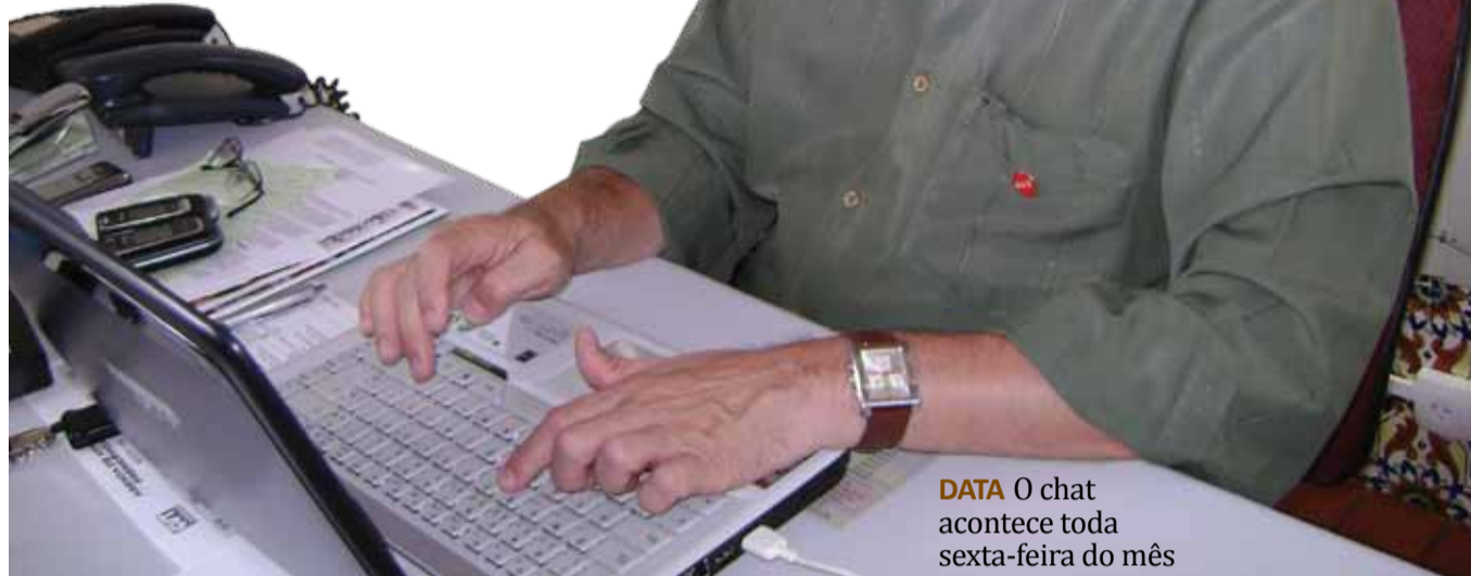
DATA O chat acontece toda sexta-feira do mês