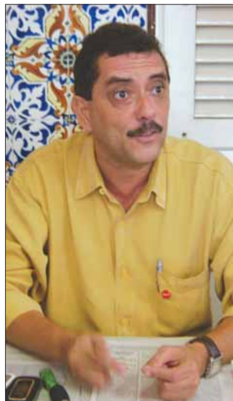
LEI "Lutar até a última instância"

Para esclarecer as possíveis dúvidas dos servidores do Ibama envolvidos no processo 331/91, a direção do Sindicato realizou, no dia 7 de agosto, uma assembleia geral extraordinária, na sede do órgão. "Enquanto existirem recursos, nós, do Sindsep, estaremos lutando na