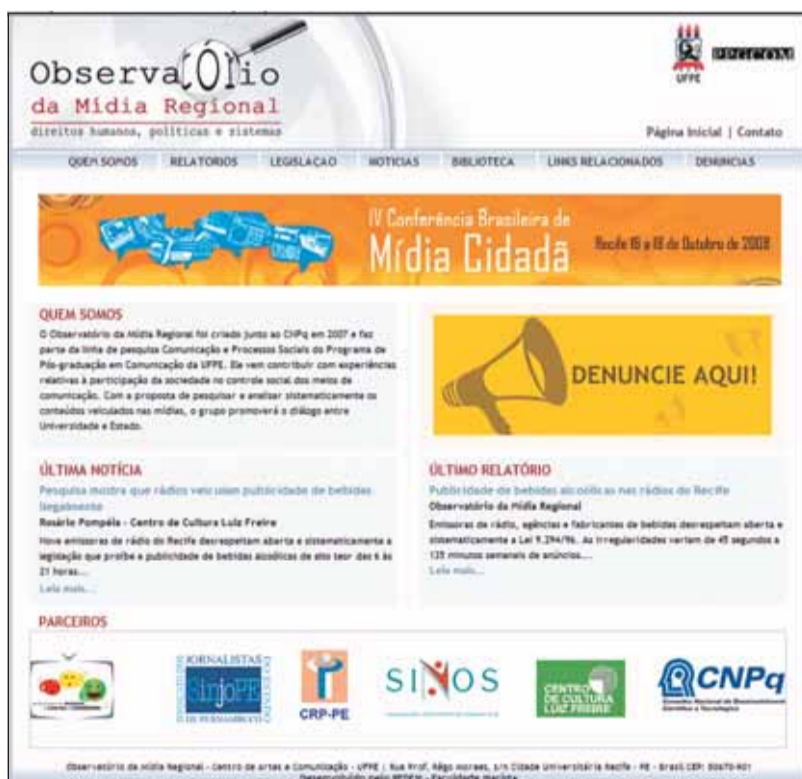
OUTUBRO Observatório coordena a IV Conferência Mídia Cidadã

“A população pode denunciar, no site do Observatório, qualquer tipo de violência contra a cidadania produzida por parte da mídia”