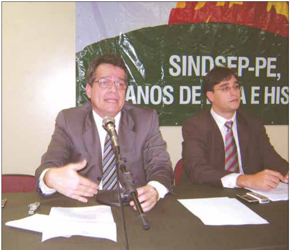
ORIENTAÇÃO Os advogados explicam quais são os recursos possíveis