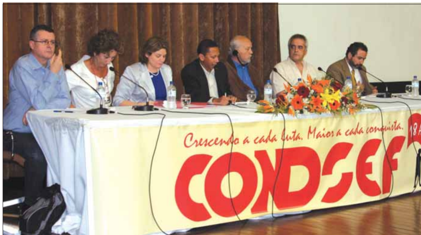
PARCERIA No Seminário foi sugerido um maior intercâmbio entre os servidores públicos da América Latina

BRASIL - O mexicano Eduardo Calderón, especialista em atividades para as pessoas da OIT, enfatizou que um país onde trabalhador não tem garantido o direito à negociação coletiva é um país com déficit de desenvolvimento. Ele disse que a Organização vem prestando assistên-