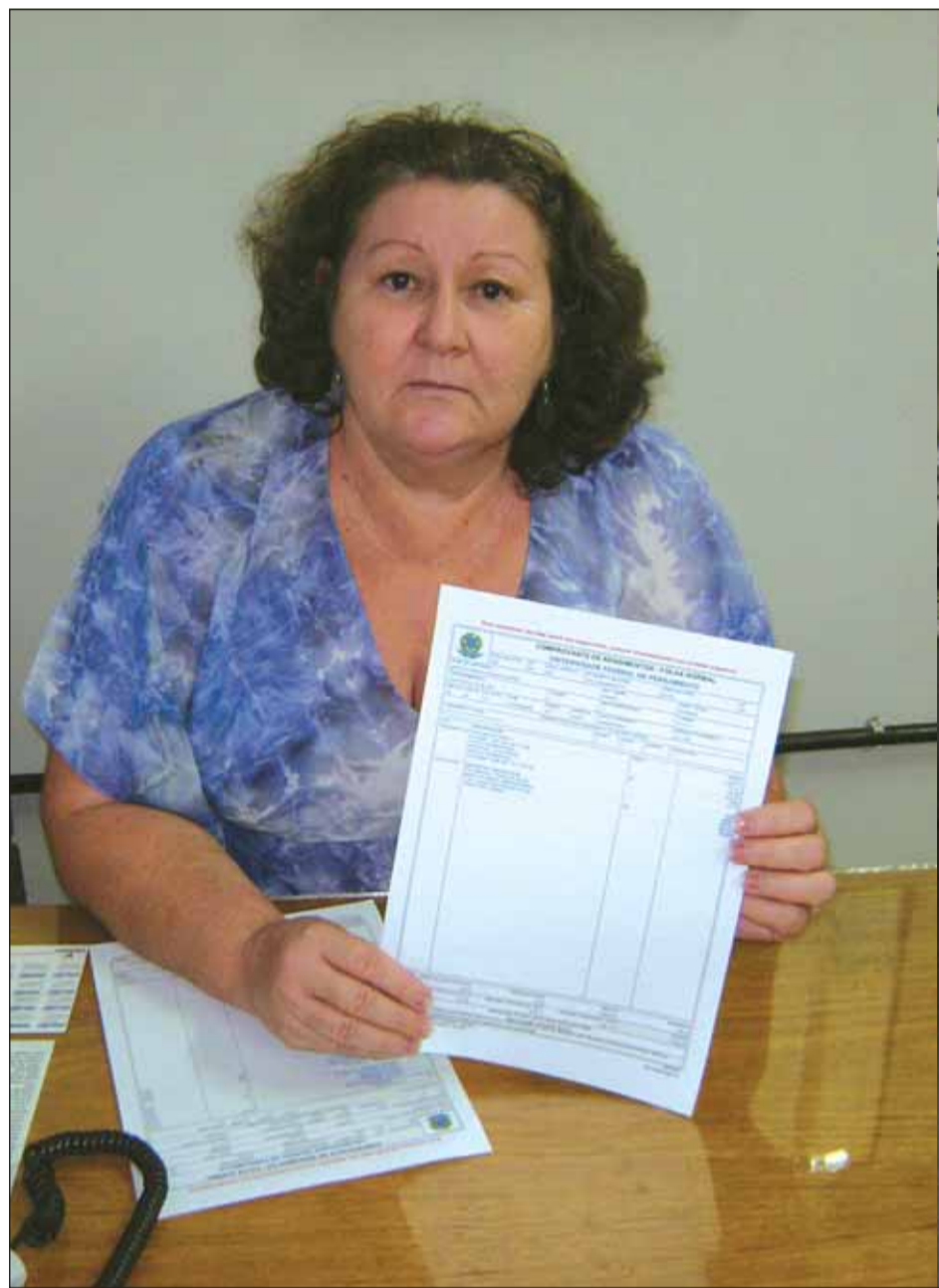
INJUSTIÇA "Fico indignada com o que sai na imprensa"