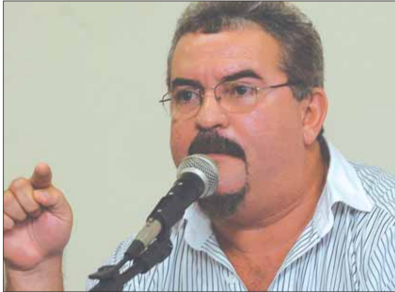
VOTO "A base política do país é evidenciada na disputa eleitoral"

E é esse um dos pontos chaves da Plataforma: votar em