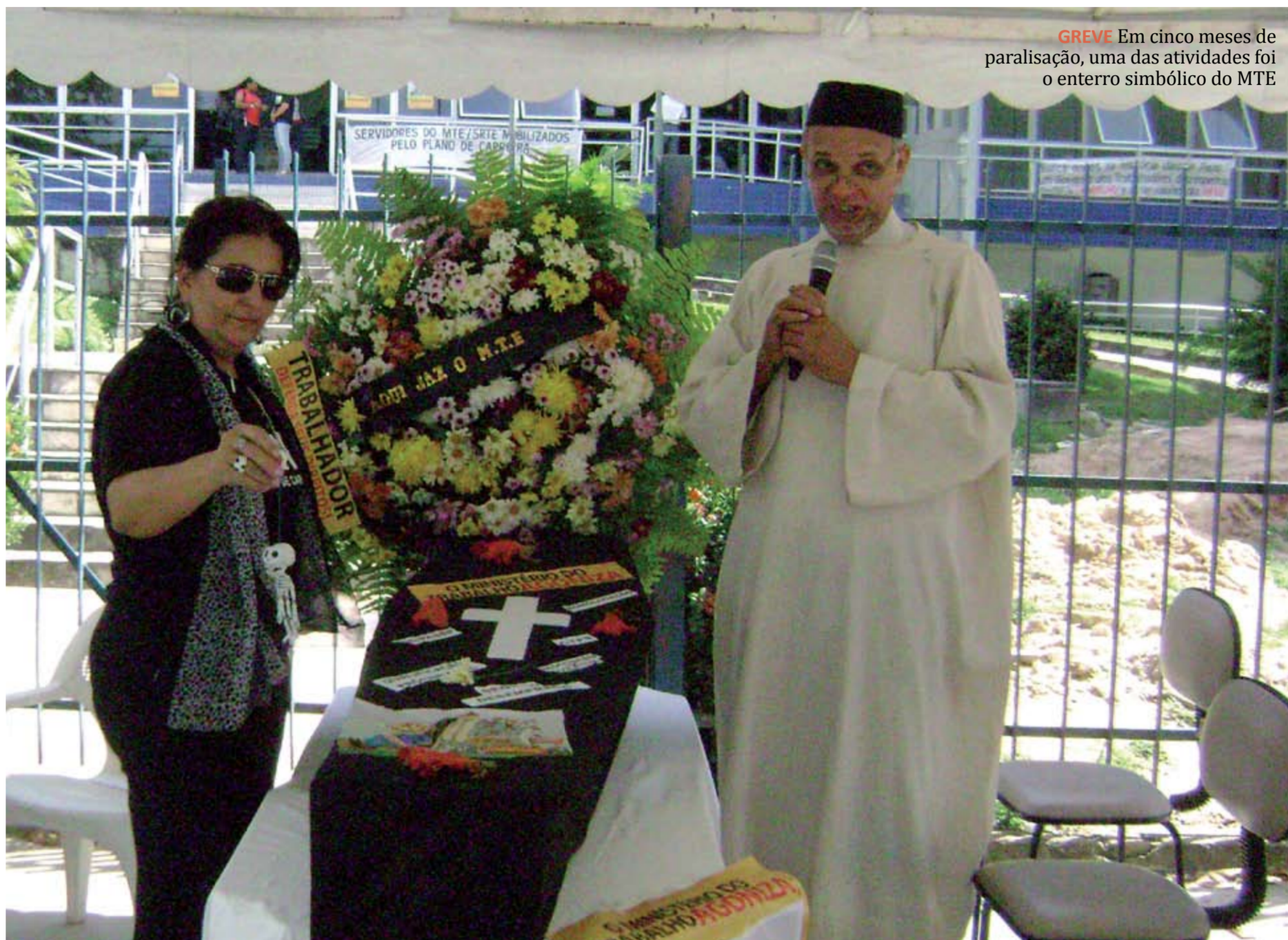
GREVE Em cinco meses de paralisação, uma das atividades foi o enterro simbólico do MTE

A paralisação nacional do MTE foi decretada diante da falta de perspectiva do atendimento às reivindicações setoriais depois da quebra do acordo por parte do governo. Em nível nacional, a paralisação começou em 6 de abril e, em Pernambuco, no dia 13 do mesmo mês. Os servidores lutam por