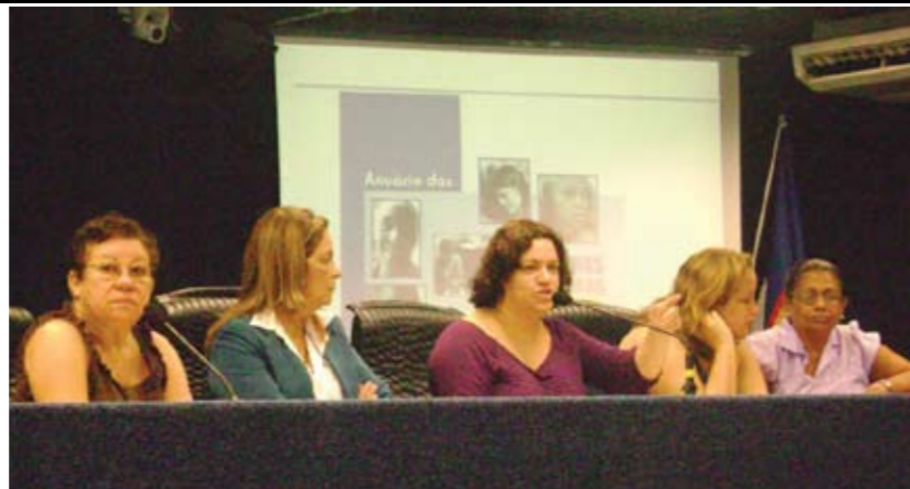
FEMININA Muitas mulheres compareceram à Assembleia Legislativa para prestigiar o lançamento do Anuário de Mulheres Brasileiras