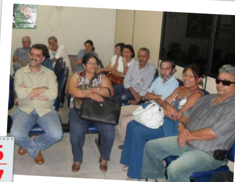
Ministério da Fazenda no Cabo