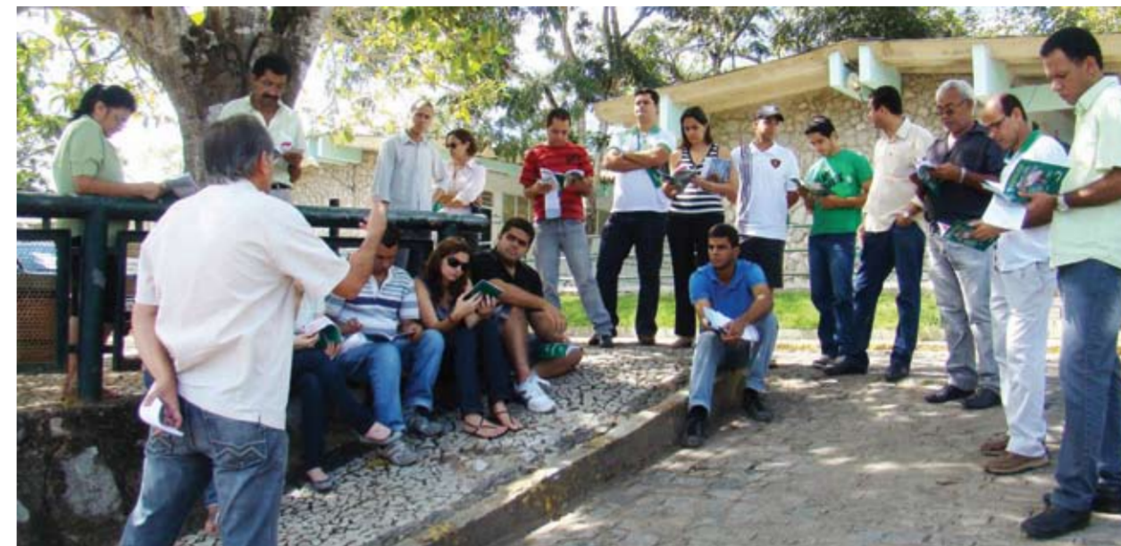
24 HORAS Além do Iphan e do Inbra, outro órgão que suspendeu os serviços foi o IF de Vitória

No caso dos servidores do DNOCS, será reaberto o prazo