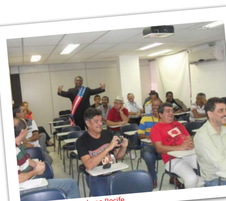
Ministério da Fazenda no Recife