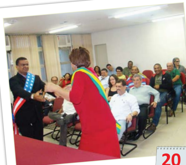
AGU do Espinheiro