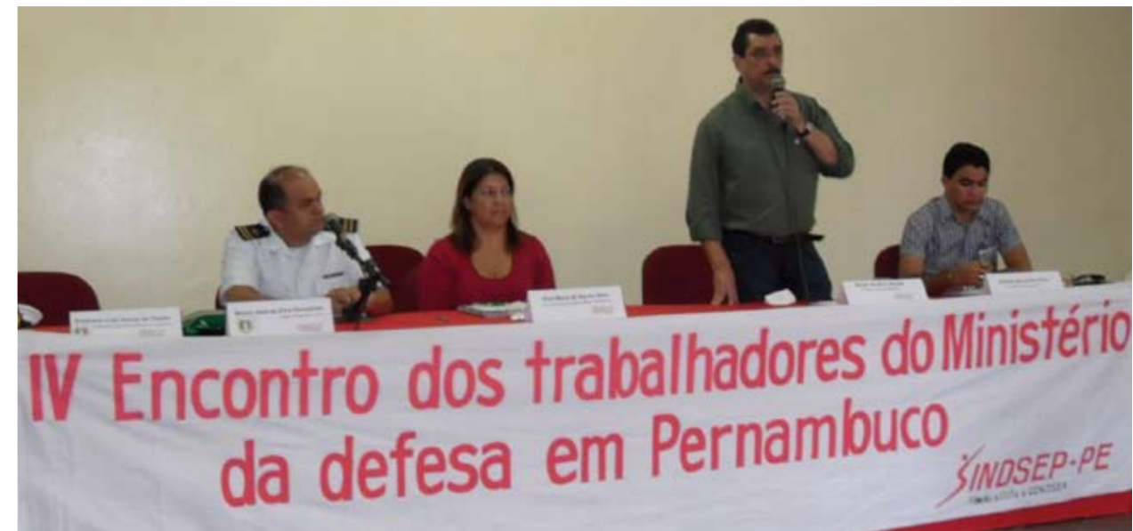
SOLENIDADE A abertura do evento contou com representantes dos comandos da Marinha e do Exército