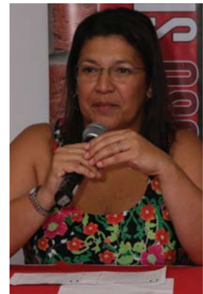
ELNA "Resgate da organização"

"O destaque que podemos fazer é que ressurge entre os trabalhadores, o que é uma luta do Sindsep, o resgate das organizações por local de trabalho. Cada segmento apontou a forma, a importância e a necessidade em organizar esses trabalhadores e que essa conformação permitirá resolver questões, fortalecer