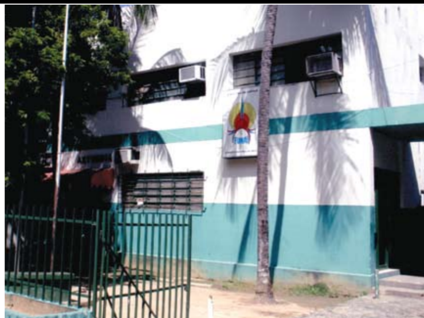
DESMONTE Com a reestruturação, o órgão no Estado foi esvaziado

Associada à luta do Sindsep e dos servidores da Funai, um dos fatores que podem ter contribuído para pressionar os deputados federais foi um manifesto elaborado por mais de 700 índios, durante o VIII Acampamento Terra Livre, realizado em Brasília, de 2 a 5 de maio. No texto, os índios afirmam que são contra a reestruturação da Funai, que viola os direitos indígenas, alegando que os processos de demarcação estão paralisados e as terras estão desprotegidas.