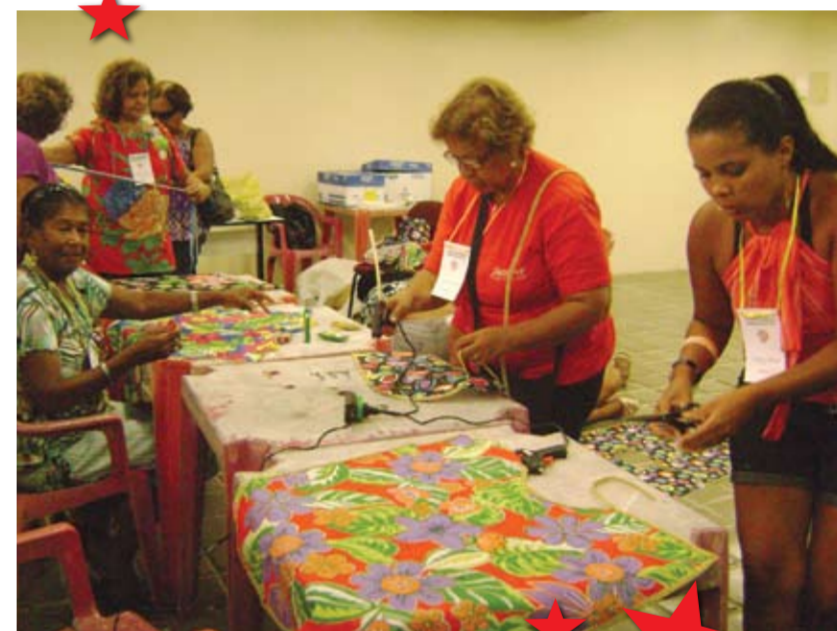
RURAL A manta do maracatu foi a pedida do terceiro dia de mini-curso