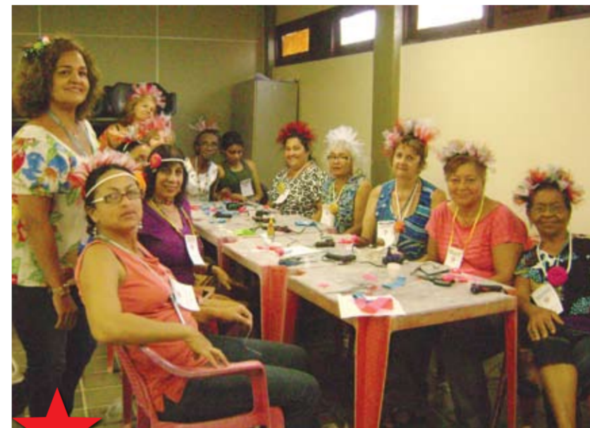
CABEÇA FEITA As tiaras, um dos adereços preferidos das foliãs, reinaram no segundo dia de oficina

Embalados com o som ambiente do frevo e do maracatu os alunos se inspiraram na produção. No primeiro dia o forte foi a produção de colar, enquanto no segundo, foi a confecção de tiaras. No terceiro e último dia da oficina, os novos artesãos capricharam na confecção de uma manta de maracatu rural, que foi enriquecida com o chapéu típico. Uma experiência que merece ser reeditada no carnaval de 2012.