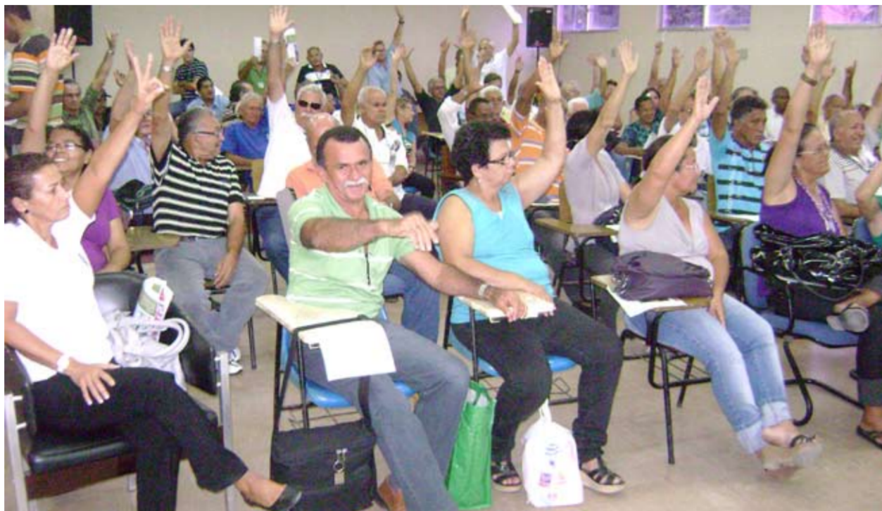
DESCONTO Trabalhadores autorizam Sindsep a receber e devolver o Imposto Sindical

Os trabalhadores presentes na assembleia foram unânimes em reconhecer a legitimidade do Sindsep-PE. Caso o Imposto Sindical seja de fato descontado foi deliberado que o sindicato irá recebê-lo e realizará outra assembleia para encaminhar a sua destinação. Muitos trabalhado-