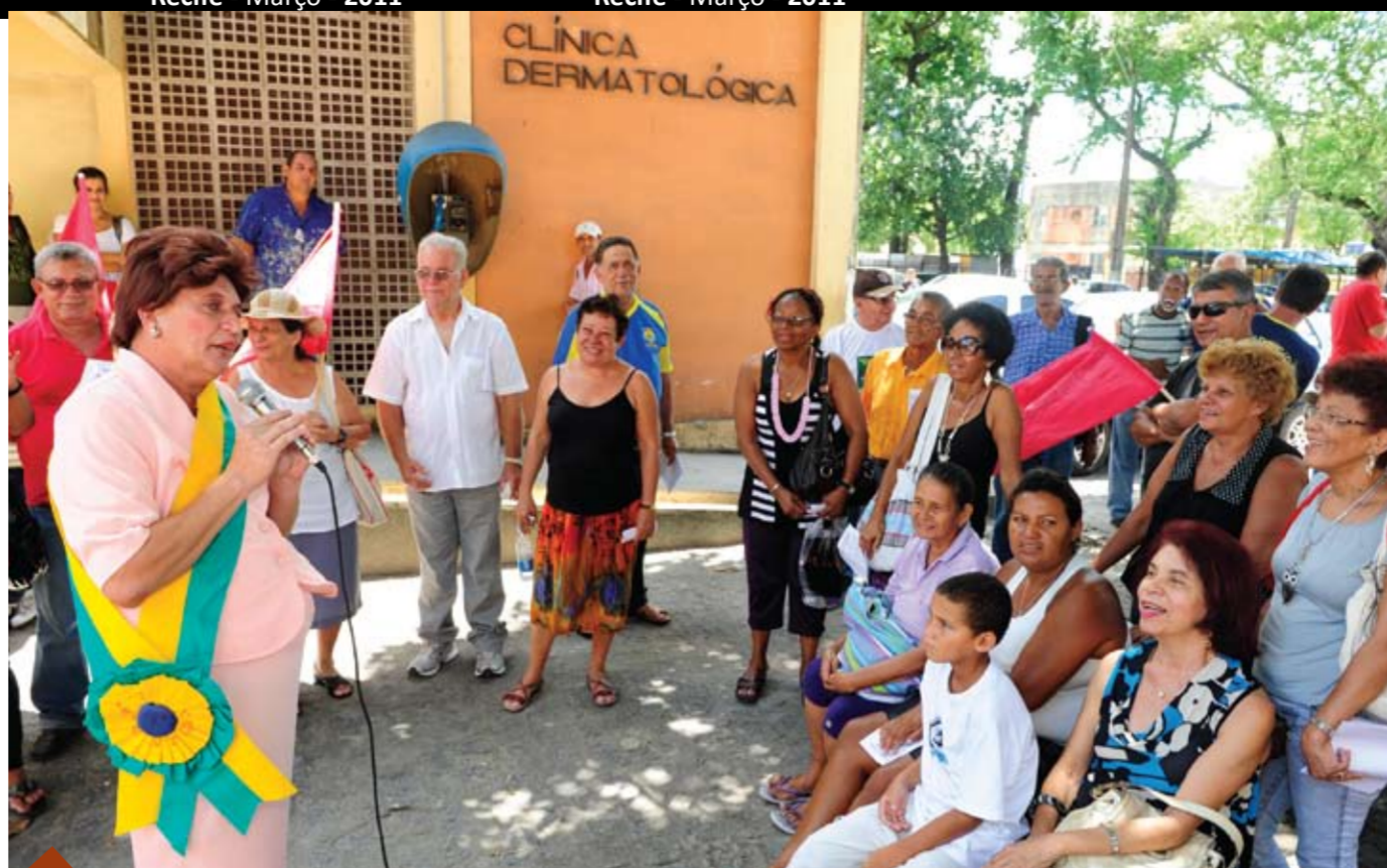
TEATRO TV Sindical passou a mensagem política dos servidores federais em tom de sátira

A partir de abril, o Sindsep inicia o calendário de assembleias com os servidores federais para discutir a campanha salarial 2011. A ideia é começar a maratona pelos órgãos do Recife e Região Metropolitana, para, a partir de maio, pegar a estrada e levar a discussão da campanha para o interior do Estado. Confira ao lado o calendário para abril e participe.