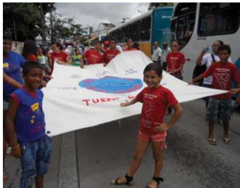
TURMA DO FLAU O recado da criançada presente na manifestação