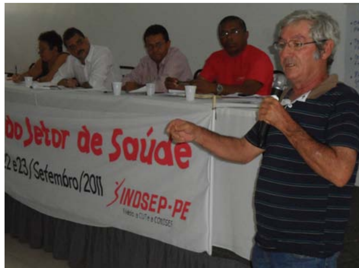
SABATINA Servidores aproveitaram para tirar dúvidas e eleger delegados para o encontro nacional

Segundo João Rufino, do Coletivo de Saúde da CUT-PE, “o governo está sendo omisso com essas pessoas. Parece até que estão esperando que o número de pessoas doentes diminua com o tempo, o que só acontece