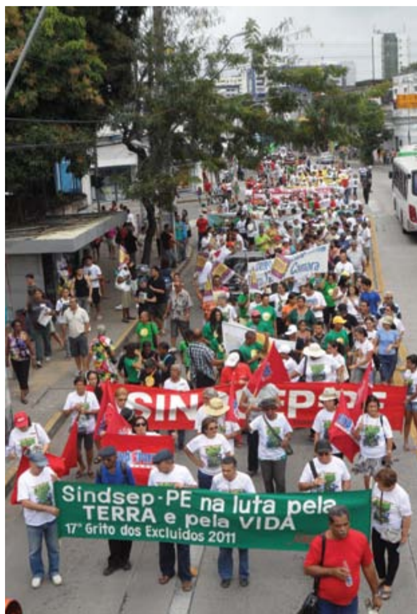
COMPROMISSO Sindsep-PE marcou presença no Grito

Goiana também frisou que desde 1995 o sindicato participa do Grito dos Excluídos, convocando e mobilizando os servidores de sua base para compartilhar e disseminar as propostas. "Queremos que a maioria da população brasileira tenha acesso às riquezas naturais do nosso país. Hoje, esse acesso fica restrito a apenas 5% da população", complementou.