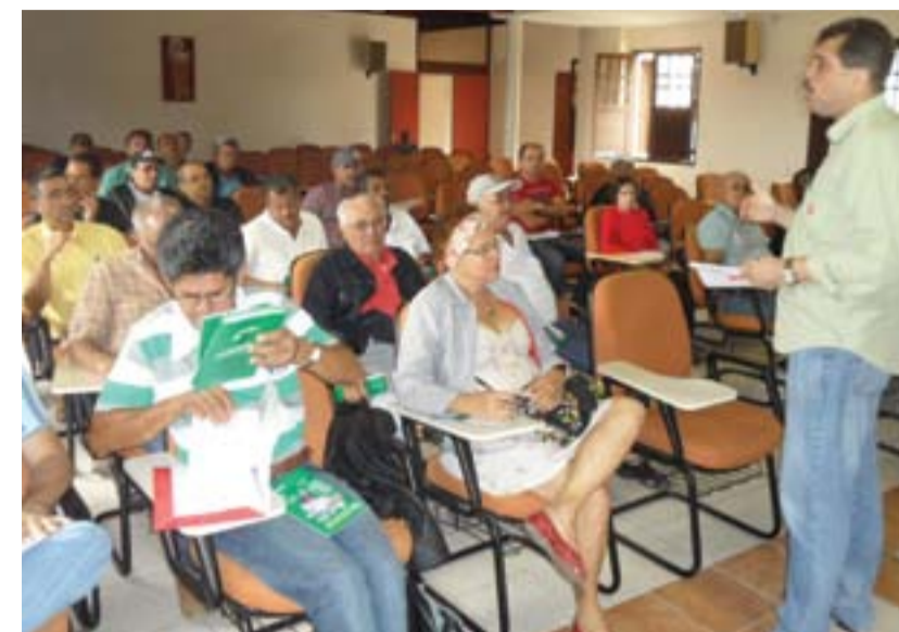
ASSEMBLEIA Sindsep-PE levou os informes para Garanhuns

Exemplo dessas distorções são os artigos 86 e 87 do PL, os quais propõem alterações na Lei 8.112/90, que trata do pagamento dos adicionais de insalubridade e periculosidade